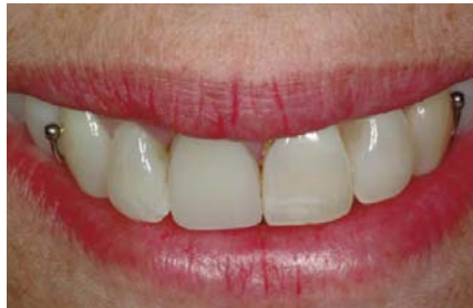
Herausnehmbare Teilprothesen mit Klammern