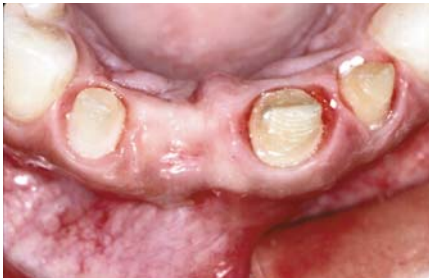
Brücken auf beschliffenen Zähnen