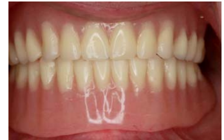
Totalprothesen oder Vollprothesen ohne zusätzliche Haltungen